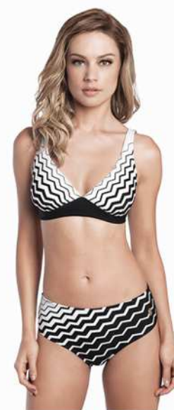
Jessica: 238-4007 Tam: 40 ao 48