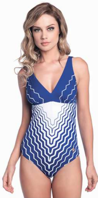
Rita: 244-3302 * Tam: 40 ao 60