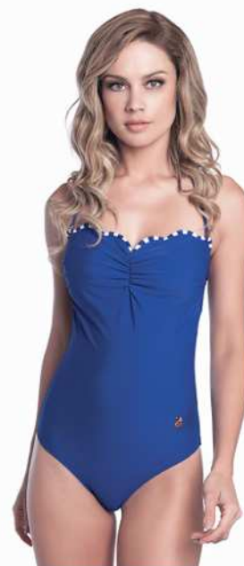
Elizabeth: 218-4002 Tam: 40 ao 48