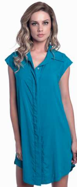
Eva: 204-4079 Tam: P/M/G/GG