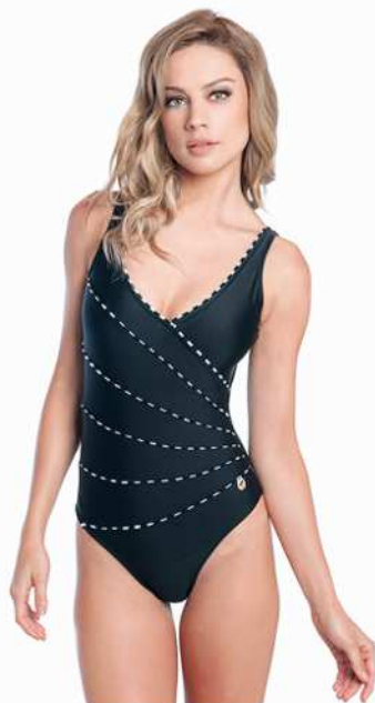
Lauren: 201-3180 Tam: 40 ao 50