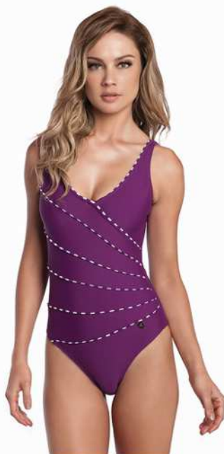
Lauren: 210-3180 Tam: 40 ao 50