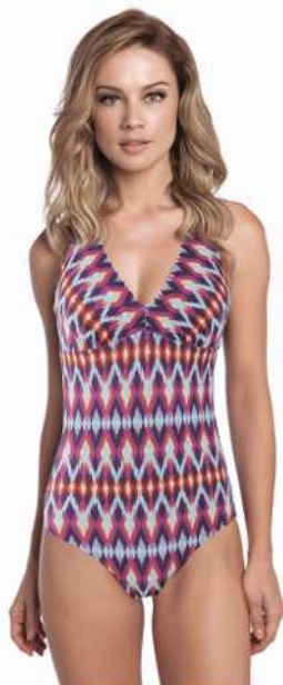
Rita: 251-3302 * Tam: 40 ao 60