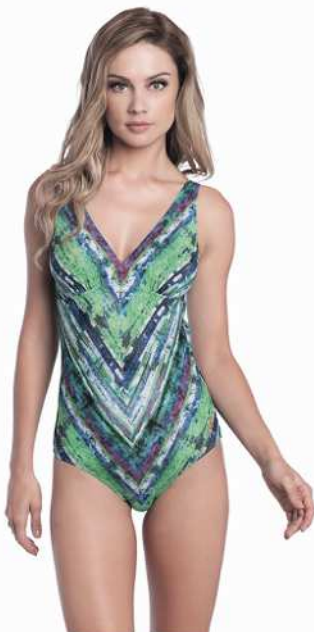
Rita: 245-3302 * Tam: 40 ao 60