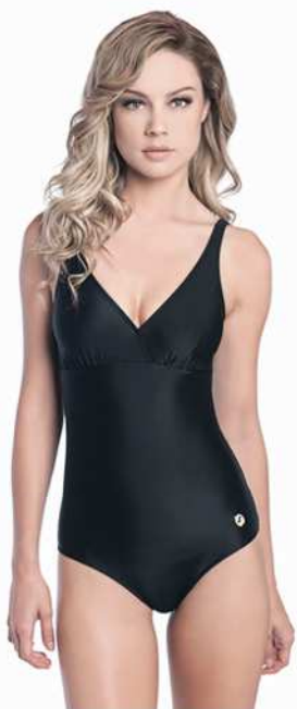
Tonia: 201-3004 * Tam: 42 ao 60