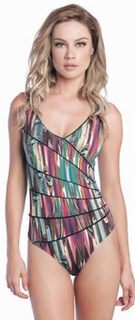
Lauren: 239-3180 Tam: 40 ao 50