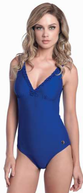
Rita: 218-3302 * Tam: 40 ao 60