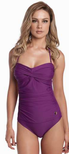
Audrey: 210-4000 Tam: 40 ao 48