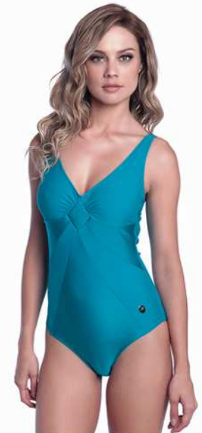
Sharon: 204-3300 Tam: 42 ao 50