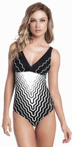
Rita: 238-3302 * Tam: 40 ao 60