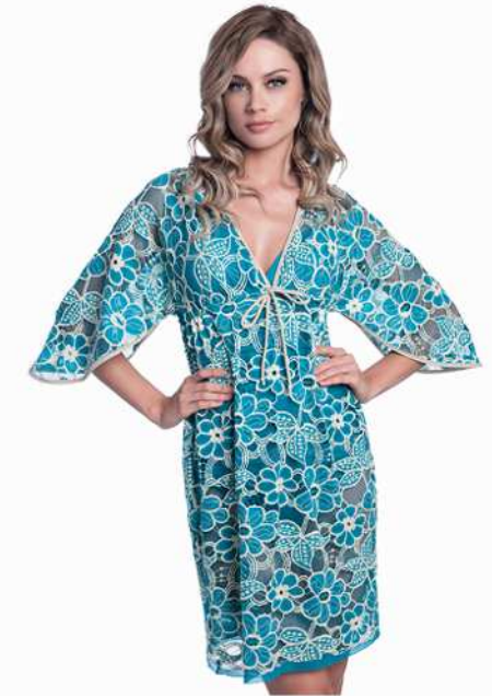
Emma: 204-4080 Tam: P/M/G/GG