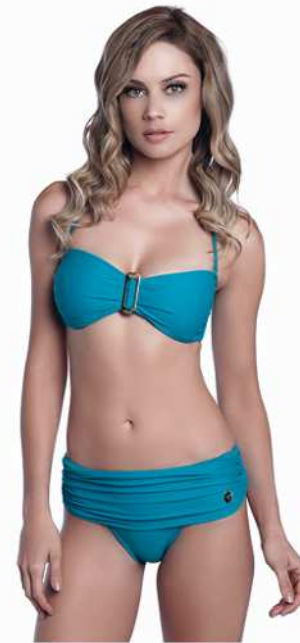
Lily: 204-4017 Tam: 40 ao 48