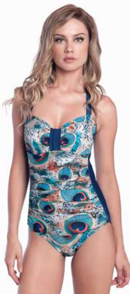
Diane: 246-4004 Tam: 40 ao 50