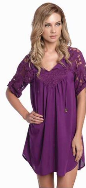
Luiza: 210-4083 *Tam: P/M/G/GG/50/52/54