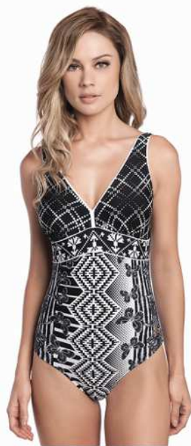
Grace: 236-3536 * Tam: 40 ao 60