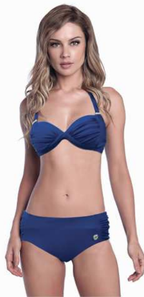
Caroline: 218-4003 Tam: 40 ao 48