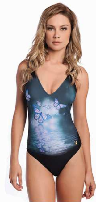
Farah: 240-3880 Tam: 40 ao 50