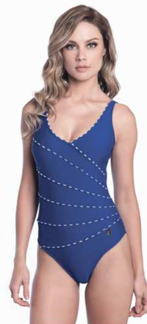
Lauren: 218-3180 Tam: 40 ao 50