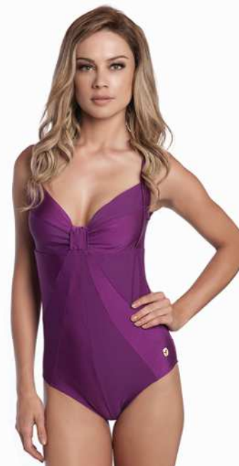
Pamela: 210-3200 Tam: 40 ao 50