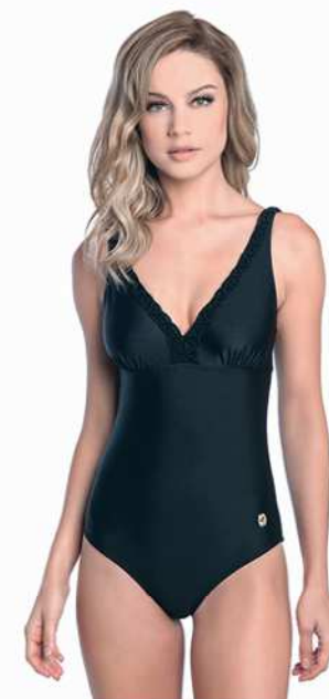
Rita: 201-3302 * Tam: 40 ao 60