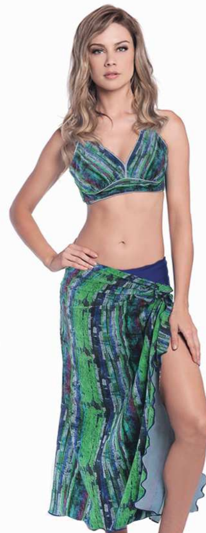
Pareo: 245-3973 Tam: único