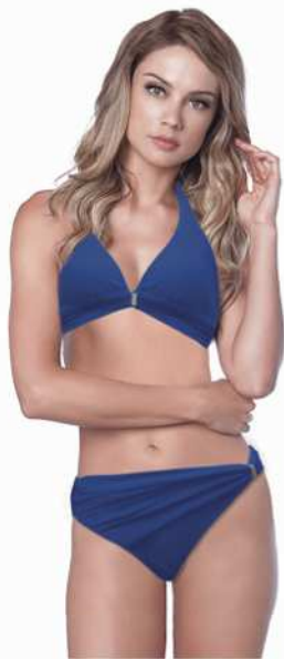
Sylvia: 218-4005 Tam: 40 ao 48