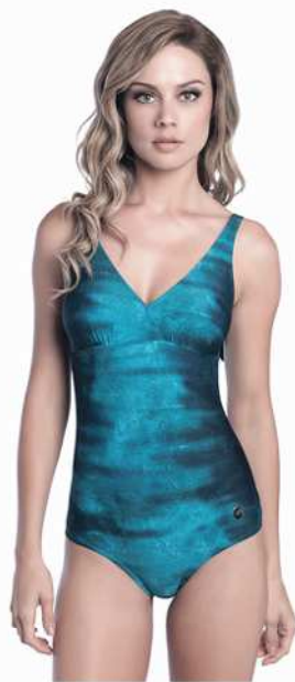
Tonia: 247-3004 * Tam: 42 ao 60