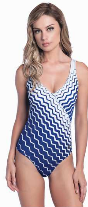
Marlene: 244-3150 Tam: 40 ao 50