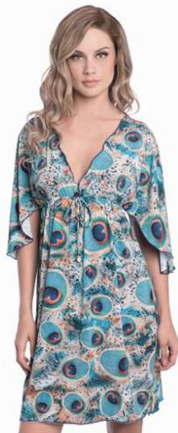
Emma: 246-4080 Tam: P/M/G/GG