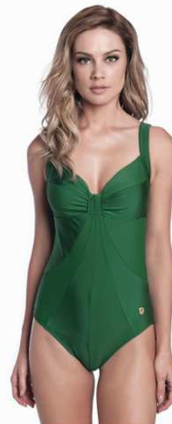
Pamela: 215-3200 Tam: 40 ao 50